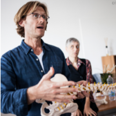
Manipulation Structurale Tissulaire : Module 1 – Vertébral haut