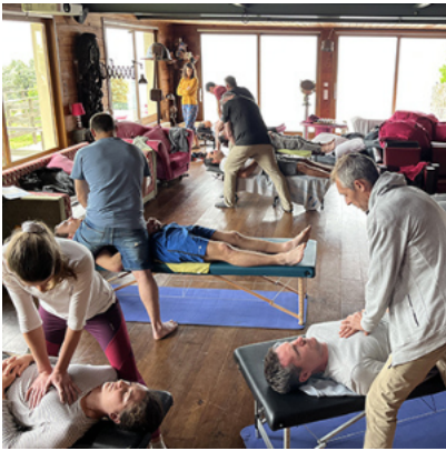
Manipulation Structurale Tissulaire : Module 2 – Perfectionnement